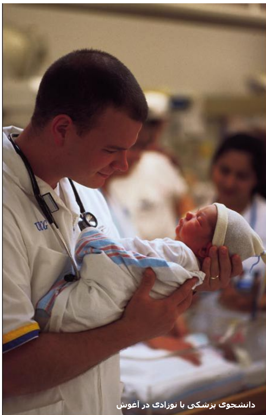
دانشجوی پزشکی با نوزادی در آغوش