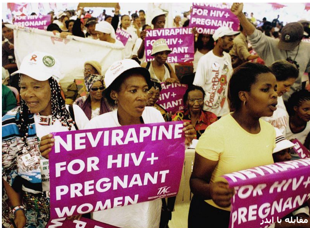
مقابله با ایدز