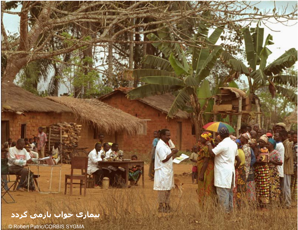
بیماری خواب بازمی گردد