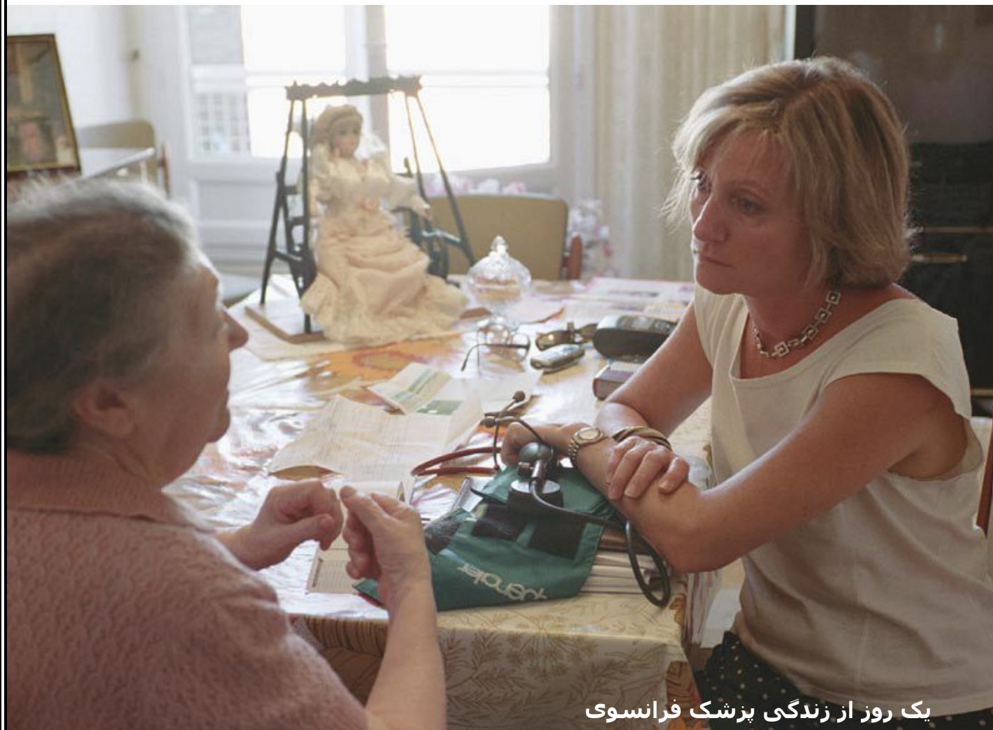
یک روز از زندگی پزشک فرانسوی