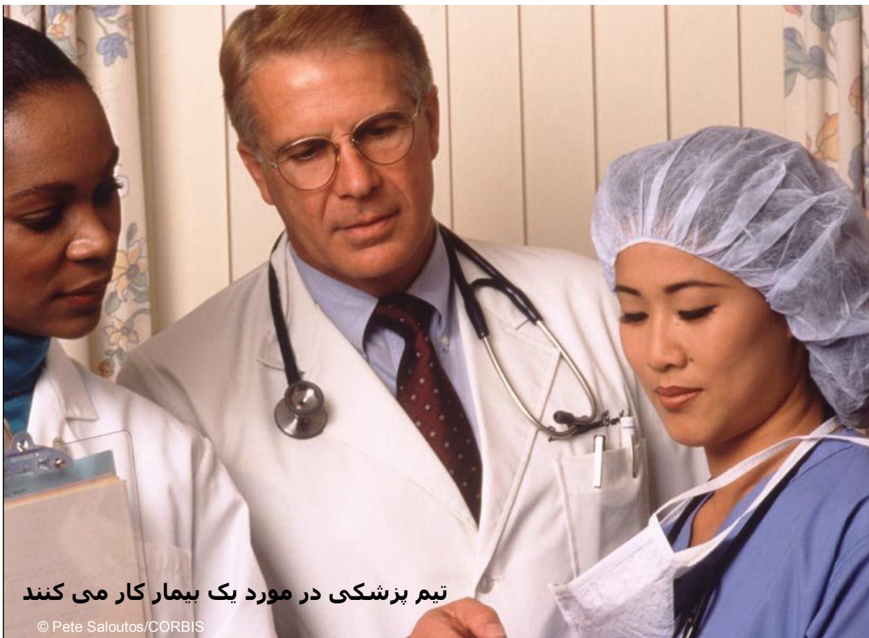
تیم پزشکی در مورد یک بیمار کار می کنند